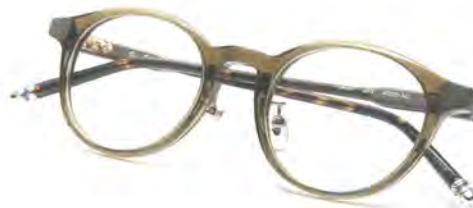
「th-007 Col.3」 価格 2 万8600円