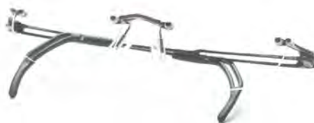
「Siem-II SI12 Col.Red Brown」 価格 6 万6000円