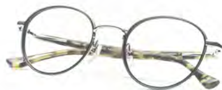
「TS-10926 Col.002」 価格 4 万9500円