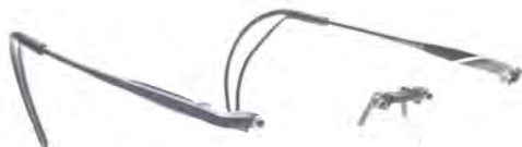
「X C1B Col.Deep Blue」 価格 4 万9500円