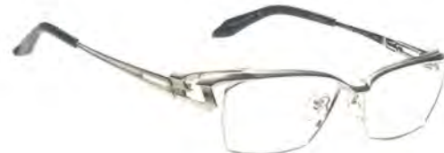
「MF-1308 Col.1」 価格 5 万2800円