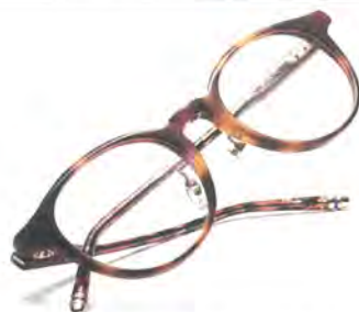
「th-007 Col.2」 価格 2 万8600円