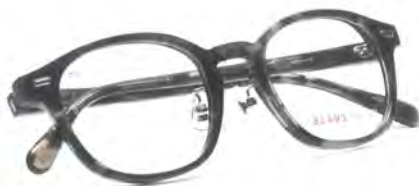
「BD-5099M Col.2」 価格 2 万9000円