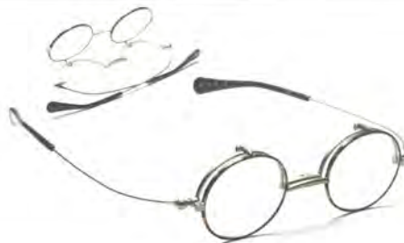
「SI-13 Col.2」 価格 6600円