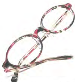
「TS-10785 Col.bloom」 価格 4 万1800円