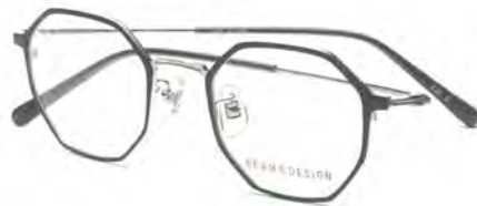
「BD-5097 Col.3」 価格 2 万9000円