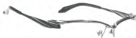
「MF-1309 Col.2」 価格 5 万2800円